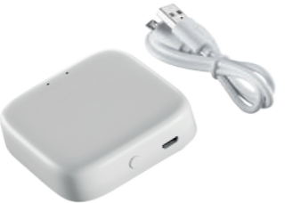
Комплект поставки - шлюз, USB-кабель и руководство пользователя для легкой настройки.