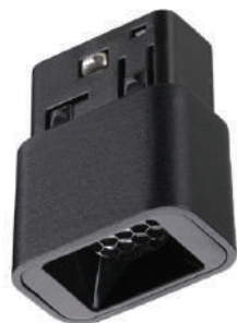
Арт. 359513; 359515