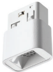
Арт. 359512; 359514